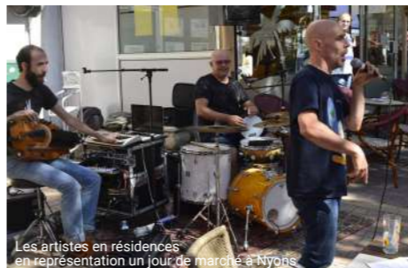
Les artistes en résidences en représentation un jour de marché à Nyons

Les premières rencontres entre les compagnies invitées et les acteurs du territoire ont débuté en septembre 2015. Elles ont donné naissance à de nombreux échanges et des rencontres à travers des ateliers d'initiation, des conférences slamées ou encore des concerts. Plus de 700 personnes ont découvert des propositions et des pratiques artistiques autour de l'écriture, de la voix, des instruments de musique, des mots..