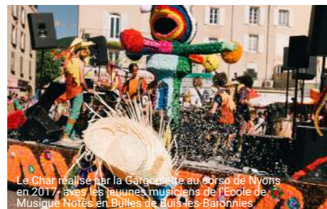
Le Char réalisé par la Gargoulette au corso de Nyons en 2017, avec les jeunes musiciens de l'École de Musique Notes en Bulles de Buis-les-Baronnies

Ces participations sont complétées par des financements européens, pour un