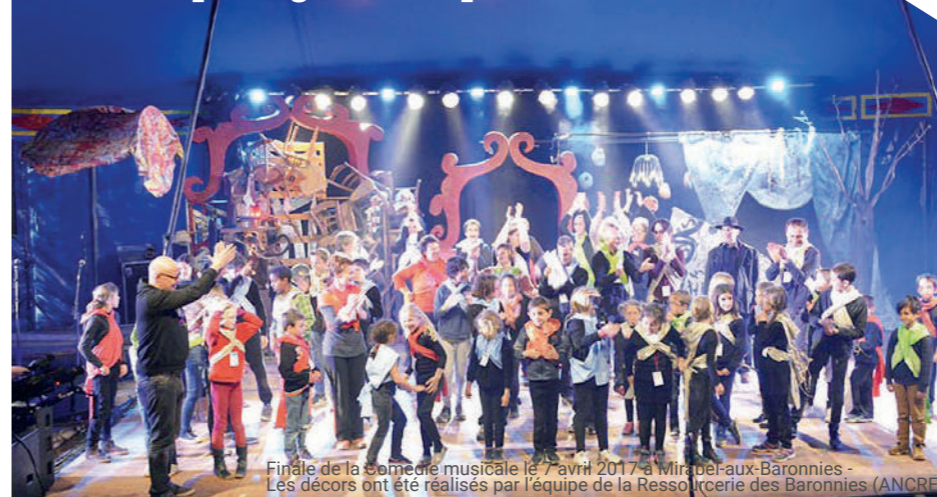
Finale de la comédie musicale le 7 avril 2017 à Mirabel-aux-Baronnies - Les décors ont été réalisés par l'équipe de la Ressourcerie des Baronnies (ANCRE)